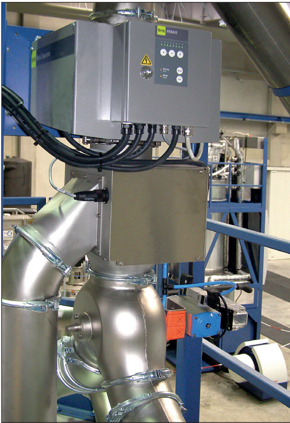
Einbaubeispiel: Metall-Separator RAPID VARIO-FS eingesetzt zur Qualitätskontrolle bei der Abfüllung von PET-Regenerat. (alte Ausführung)